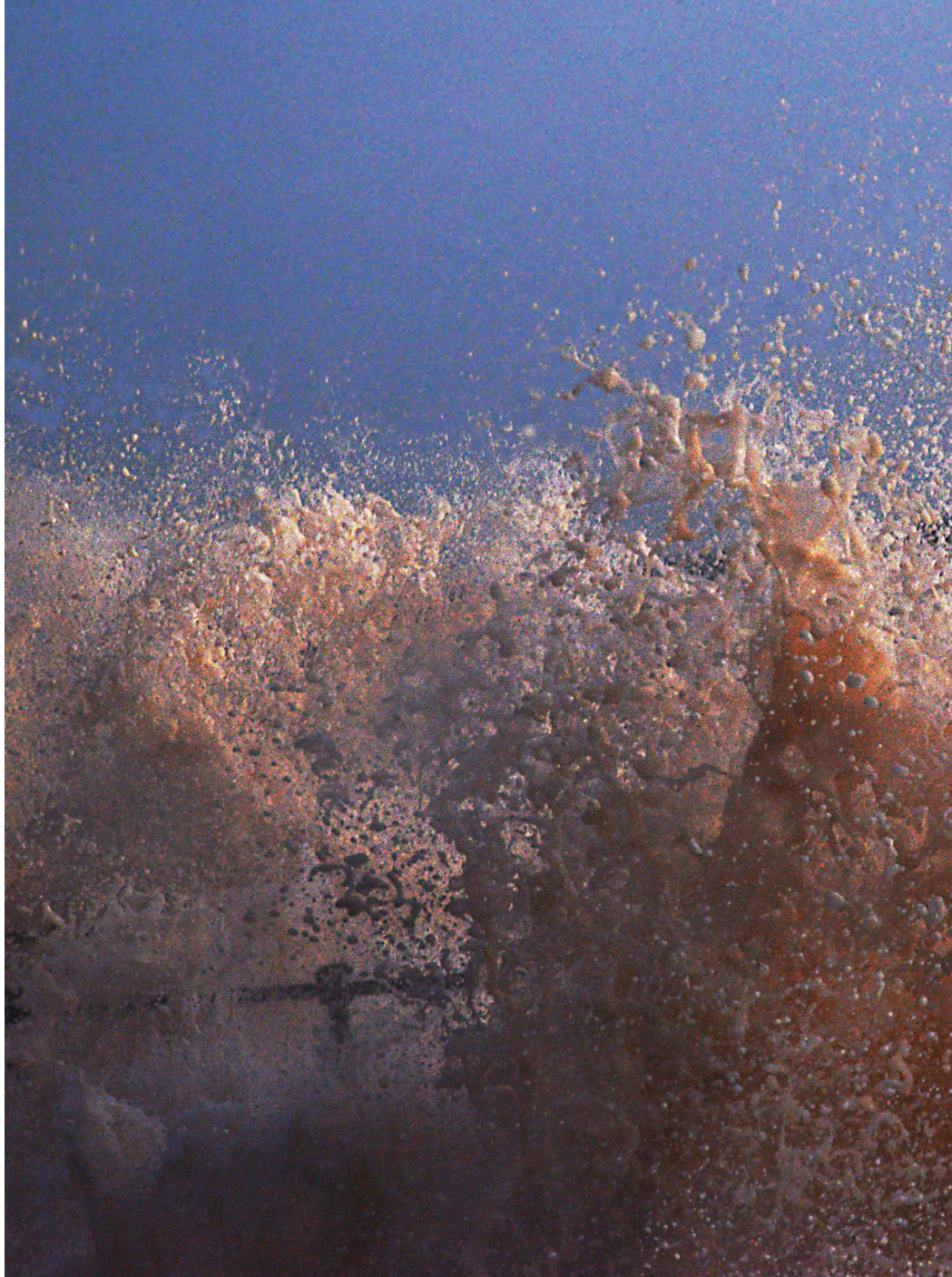
პიტერ ნესმიტი, გაერთიანებული სამეფო ქაოსი სიდმოსში, 2018, ფერადი ფოტო, A1